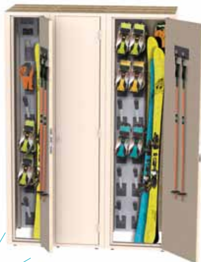
Exemple de configuration K-DOOR avec sèche- chaussures