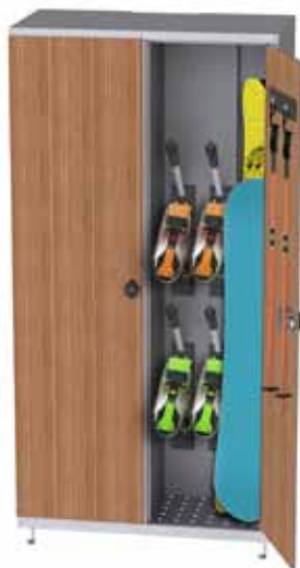
Modèle présenté K-DOOR- COMPACT façade stratifié compact